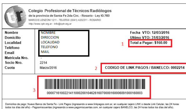
5. FIG. 4

En "3" accede al cupón de pago, Punto siguiente.