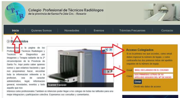
2- FIG. 1

En los datos requeridos (flecha3) es importante que coloque el mail declarado en el Colegio y en clave su Nº de Socio "NO LA MATRICULA"(Esta en su Credencial o puede solicitarlo por teléfono) Precedido por las 2 (dos) primeras letras de su apellido.